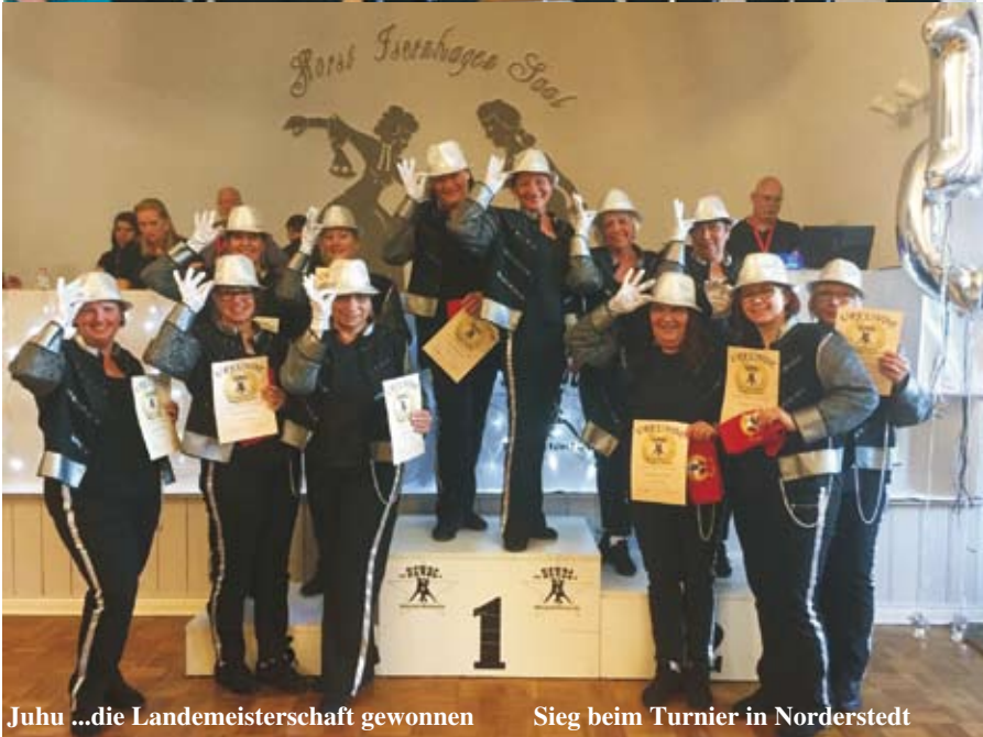
Juhu ...die Landemeisterschaft gewonnen