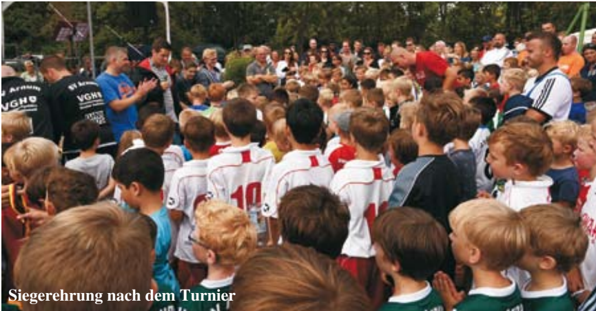
Siegerehrung nach dem Turnier

Bereits ab 10:00 Uhr startet das VGH U7/Bambini und U9-Jugend Turnier mit einer großen Teilnehmerzahl und vielen Zuschauern.