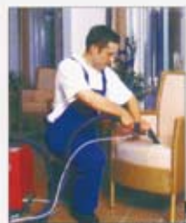
Teppichboden- u. Polsterreinigung