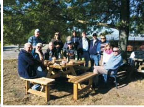
Geselligkeit mit neuer Sitzgruppe