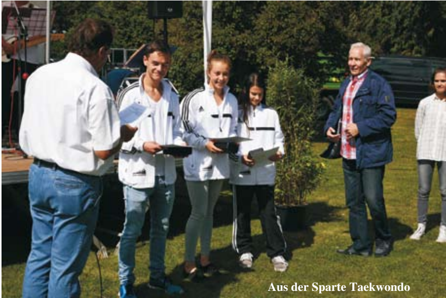
Aus der Sparte Taekwondo