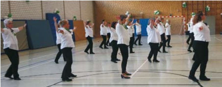
Medley mit Musik aus den 50ziger Jahren