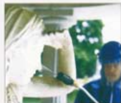
Fassadenreinigung u. Denkmalpflege